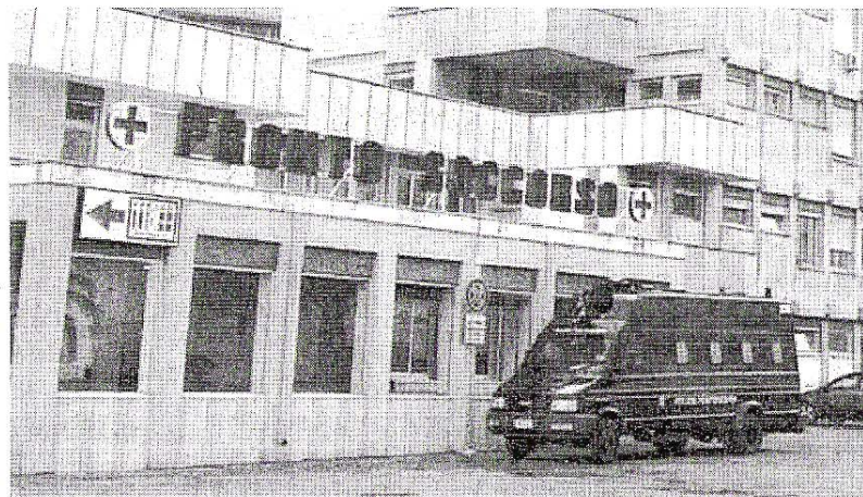
Il mezzo della polizia penitenziaria al Pronto soccorso dell'ospedale «Vito Fazzi»

Un nuovo «fronte polemico» sembra destinato ad aprirsi a Borgo San Nicola