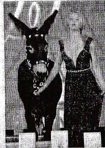
Anna Falchi e il suo ospite