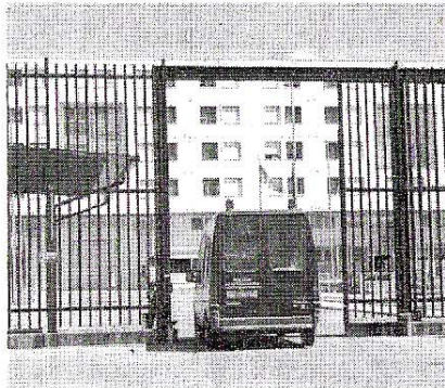
L'ingresso del carcere di Borgo San Nicola

Da gennaio all'interno del supercarcere ci sono state almeno sette aggressioni. «Le istituzioni e gli organi superiori del Dipartimento», conclude Pantaleo, «devono prendere provvedimenti per il rilancio della struttura, un tempo competitiva e collaborativa rispetto a tutte le componenti».