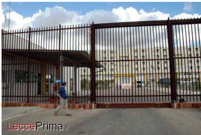
Il carcere di Borgo San Nicola.

Se il clima in questi giorni nel Salento è reso particolarmente teso dall'emergenza criminalità con due omicidi, seppur slegati fra loro, in appena una settimana, dopo anni di apparente tranquillità, nelle celle del carcere di Borgo San Nicola le tensioni rimangono sempre sul filo del rasoio, pronte ad infiammare la miccia della violenza. Ieri sera l'ultima schermaglia tra detenuti e agenti di polizia penitenziaria si è conclusa con un'aggressione ai danni di un berretto azzurro ferito da un recluso napoletano. Fortunatamente nulla di grave, ma ancora una volta l'episodio di violenza appare correlato ai gravi disagi in cui versa ormai da tempo la casa circondariale leccese.