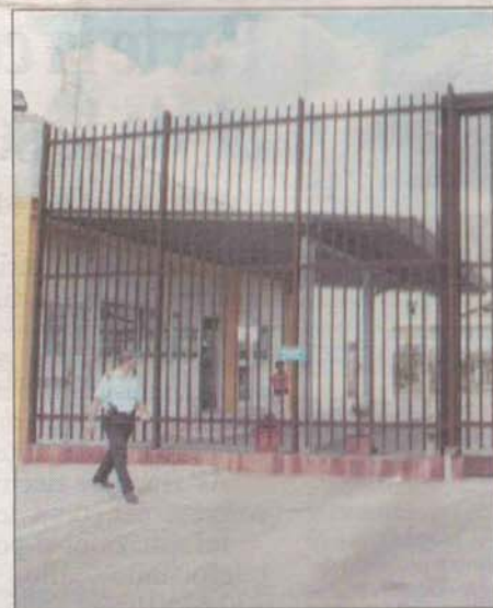
Il carcere di Borgo San Nicola

al personale di polizia presente all'interno del carcere. «Quanti agenti dovranno cadere prima che le istituzioni e soprattutto la direzione locale intervengano con i dovuti provvedimenti?», si chiede il segretario regionale della Uil-Penitenziari. «Come mai la politica è completamente disinteressata alla problematica e ai destini dell'istituzione penitenziaria leccese?», prosegue. E chiude, provocatoriamente, chiedendosi «perché tutti sono ben disposti ad occuparsi di "Caino", mentre si dimenticano di pensare agli "Abele"».