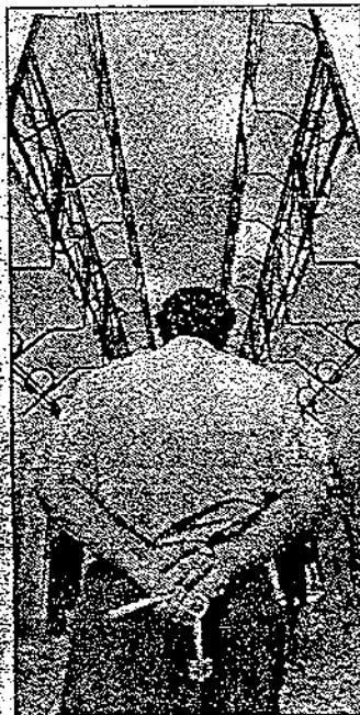
Affitti alti per la polizia carceraria

«SEMBRA una storia da "strano ma vero" della Settimana enigmistica, invece è l'ennesima prova della scarsa considerazione in cui siamo tenuti», protestano i poliziotti penitenziari che vivono con mogli e figli negli alloggi di servizio ricavati all'interno di San Vittore e al Beccaria. Agli inquinati delle galere — è la ragione della denuncia — il ministero delle Finanze ha mandato nuovi canoni d'affitto e sberle di arretrati da pagare, considerando gli appartamenti dietro le sbarre alla stessa stregua di abitazioni in norma. «I condomini. Possibile? «E così», replicano all'Agenzia del Demanio di via Mannin, che ha spedito le intimazioni di pagamento — ma noi applichiamo la legge, con le tariffe al minimo. Se il ministero di Grazia e Giustizia non ci segnalava le situazioni particolari, e non arriva un regolamento, non possiamo fare altro».